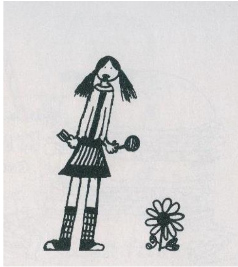
ייצוגי הדמות האנושית

הסכמה הקבועה כבר לא קיימת. מודעות גוברת לפרטי לבוש. יש פחות שימוש בהגזמה, עיוות והשמטה של חלקי גוף לצורך הדגשה. חלקי הגוף שומרים על משמעותם כשהם נמצאים בנפרד. יש יותר נוקשות בדמויות.